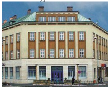
Český rozhlas Hradec Králové Havlíčková 292, 501 01 Hradec Králové rozhlas@hk.rozhlas.cz

Posloucháte Český rozhlas Hradec Králové? Zajímá vás odkud vysíláme? Jak to vypadá v zákulisí?