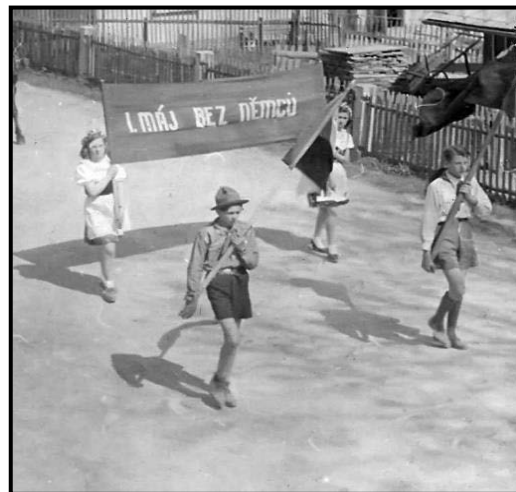
Jeden z prvních skautů – junáků v Teplicích nad Metují v prvomájovém průvodu v roce 1946 nebo 1947.

V tomto pětiletém období (1945 – 1950) působil poprvé oddíl skautů i u nás v Teplicích nad Metují.