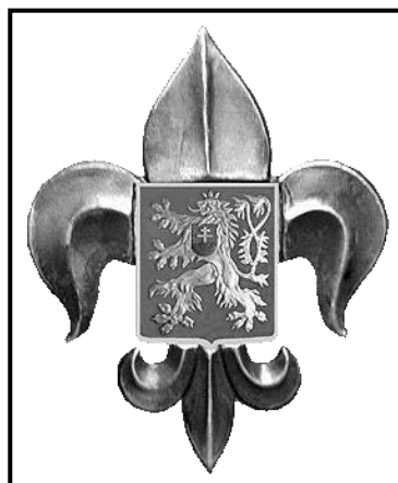
Slibový vůdcovský odznak z roku 1947.

Slibové odznaky řadových členů nebyly v tomto období jednotné. Byla to sice klasická skautská lilie s hlavou psa ve středovém štítě, ale jelikož odznaky vyrábělo několik menších podniků, byly nepatrné odchylky ve tvaru a velikosti odznaku. Některé oddíly nebo střediska používaly ještě předválečné slibové odznaky, které byly opět trochu odlišné, nebo si je některých případech junáci vyráběli sami. Tak nebylo v tomto období výjimkou, když jedno junácké středisko používalo i více odlišných variant.