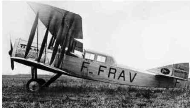
Jedna z mála fotografií Potezu typ VII zachycuje právě letoun výrobního čísla 133, označení F- FRAV, který 30.10.1922 havaroval v Supích skalách. Jednomotorový dvouplášník s cestovní rychlostí 170 km/h měl kromě místa pro pilota i kabinu pro dva cestující, létal v jasně žlutém nátěru, kryt motoru a kabina byly v barvě kovu.