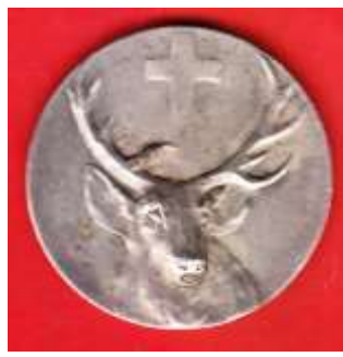
Střelecká medaile s motivem Svatého Huberta která je dílem známého medailéra A.Weinbergera. Průměr medaile je 38 mm.

Zájemci o lov a myslivost z Teplic se v předválečném období sdružovali ve spolku „Jagdclub St. Hubertus“, ve kterém se scházelo na padesát členů a zájemců o myslivost z Teplic, Bučnice a pravděpodobně i z okolních obcí, z Dědova,