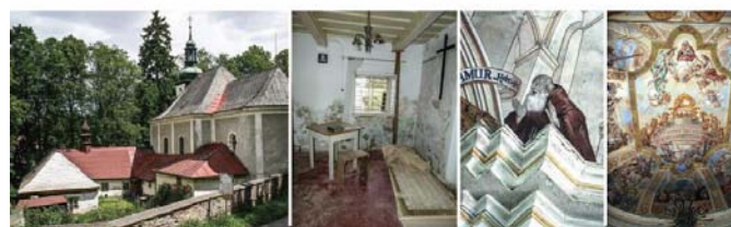
▲ Světový unikát - jediný dochovaný objekt svého druhu na světě