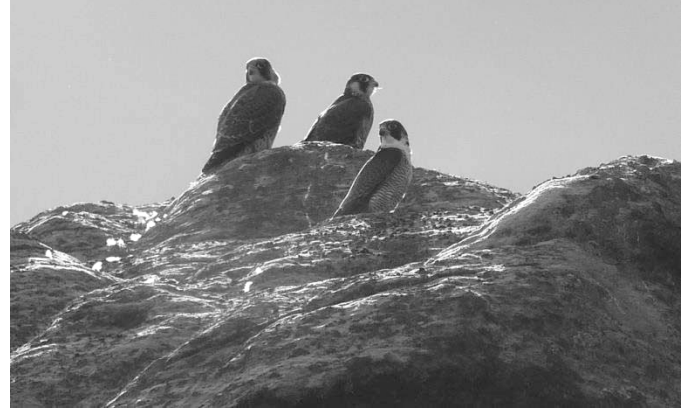
Dospělý sokol a dvě vyvedená mláďata

samice velmi citlivě reagovala na průchod turistů pod hnízdní skálou a často z hnízda vyletovala. Návrat zpět jí pak trval i 20 minut. Zejména během chladnějšího počasí a vyšší návštěvnosti skal hrozilo velké riziko zastuzení celé snůšky, a proto byla část prohlídkového okruhu skalami pro turisty uzavřena. Hnízdění pak pokračovalo bez větších komplikací a rušení, a to i v době, kdy kolem hnízda napadlo 10 cm nového sněhu a kdy teploty klesaly pod bod mrazu.